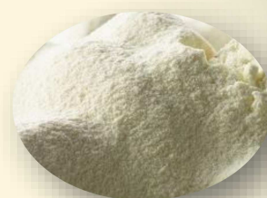
Proteine in polvere