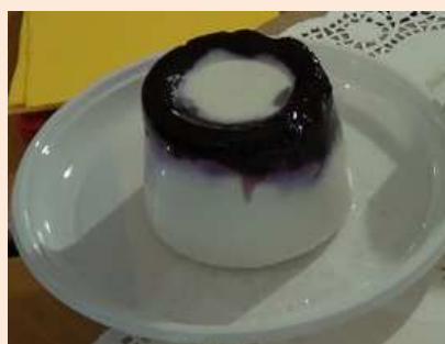
RICOTTA LISCIATA O CON FRUTTA