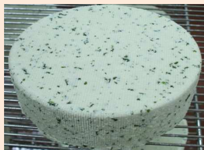
RICOTTA PRESSATA CON ERBE