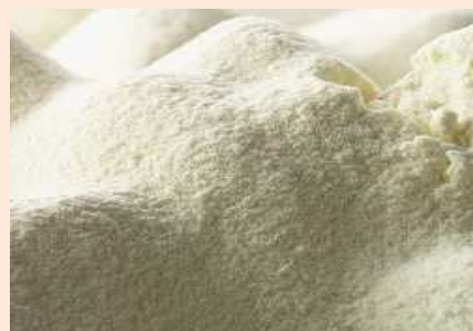
SIERO E PROTEINE IN POLVERE